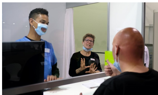
Unterstützung bei der Anmeldung durch Gebärdensprach-Dolmetscherin

Die meisten Betroffenen reagierten begeistert auf die Möglichkeit, sich in einem barrierefreien Umfeld impfen lassen zu können. Dank der transparenten Aufklärung in Gebärdensprache im Vorfeld spürten wir eine grosse Bereitschaft für die Impfung. Dennoch waren einige gehörlose Menschen bis kurz vor der Impfung etwas verunsichert. Sie hatten Fragen zum verabreichten Impfstoff und zu allfälligen Nebenwirkungen. Diese Fragen konnten im Impfzentrum dank des barrierefreien Zugangs zur Kommunikation umfassend beantwortet werden.